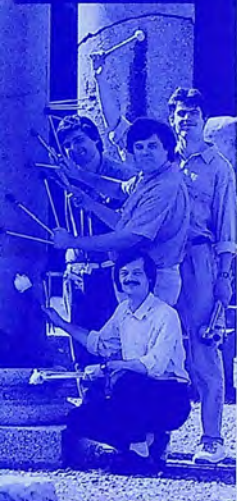
Amadinda Percussion Group

Programme: F. Kuhlau, W. A. Mozart, F. Doppler, T. Böhm, J. Demersseman, L. Hugues