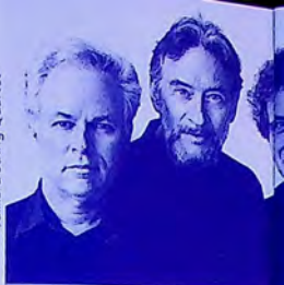
Juilliard String Quartet

Thursday Plenary Hall 5 pm Final public audition of the cello master classes