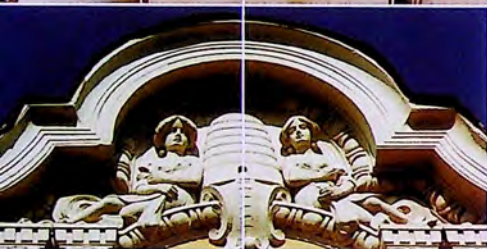
архитектурен фрагмент architectural fragment