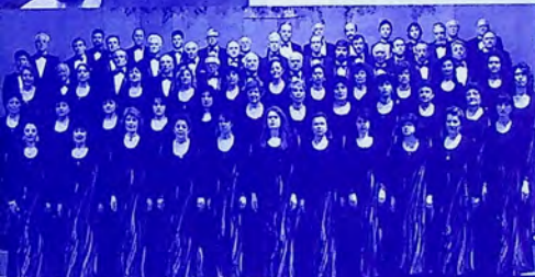
Dunavsky Zvutzy Choir Rousse