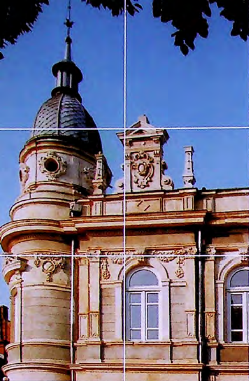
Доходно здание Theatre House