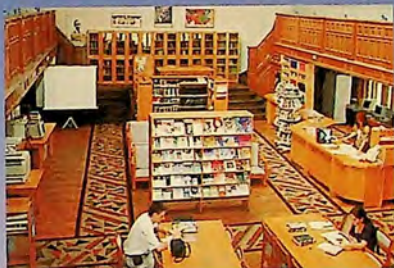
The British Studies Resource Centre, Sofia