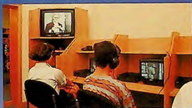
AV Room at Tulovo Street