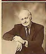
Георги ДИМИТРОВ Georgy DIMITROV