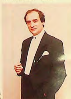
Емил ТАБАКОВ Emil TABAKOV