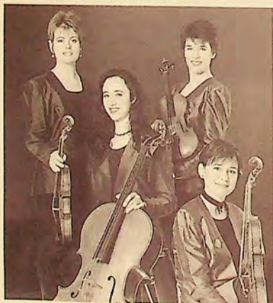
СТРУНЕН КВАРТЕТ „СОРЕЛ“ „SORREL“ STRING QUARTET

Пленарна зала, 19 ч. Plenary Hall, 7 p. m. СТРУНЕН КВАРТЕТ „СОРЕЛ“ – ВЕЛИКОБРИТАНИЯ „SORREL“ STRING QUARTET – GREAT BRITAIN Франк Бридж – Три идили Frank Bridge – 3 Idylls Шостакович – Квартет № 3 Shostakovich – Quartet № 3 Менделсон – Квартет оп. 13, ла минор Mendelssohn – Quartet op. 13, a moll Концертът се осъществява With the kindest support с любезното съдействие of the British Council на Британски съвет – София