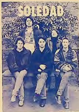
КВИНТЕТ „СОЛЕДАД“ „SOLEDAD“ PIANO QUINTET