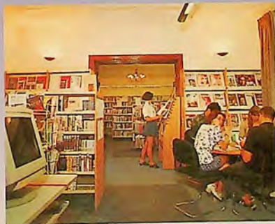
The British Council Main Library, Sofia