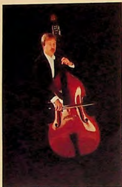
КРИСТИАН ВАНДЕР БОРГТ CHRISTIAN VANDER BORGHT

(програмата се представя за първи път в България) (Bulgarian premiere of the programme)