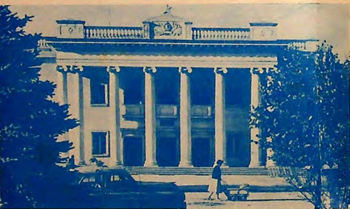
Концертната зала Концертный зал Der Konzertsaal Мостът на дружбата Мост дружбы Die Brücke der Freundschaft