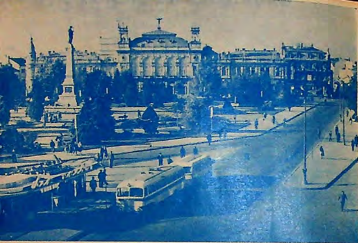
Центърът на гр. Русе Центр города Русе Das Zentrum von Russe