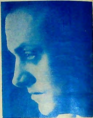
Курт Мазур Kurt Mazur