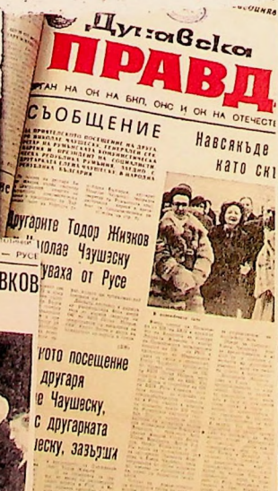
Другарите Тодор Живков и Николае Чаушеску чуваха от Русе Тото посещение на другаря Чаушеску с другарката Йеску, зазвъзди