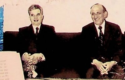
Интервю и разговори на другаря ТОДОР ЖИВКОВ и другаря НИКОЛАЕ ЧАУШЕСКУ