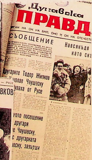
...ото посещение на другаря Чаушеску с другарката Йеску, забързали