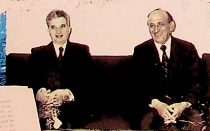
...и разговори на другаря ТОДОР ЖИВКОВ и другаря НИКОЛАЕ ЧАУШЕСКУ