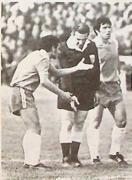
Оспорване решението на съдията

Съвременното развитие на футболната игра се характеризира с твърдост и мъжество при единборствата между състезателите, голяма издръжливост и бързина, колективен дух и универсализъм в играта. Това изисква УСТОЙЧИВА ПСИХИКА И МОРАЛНО-ВОЛЕВИ КАЧЕСТВА.