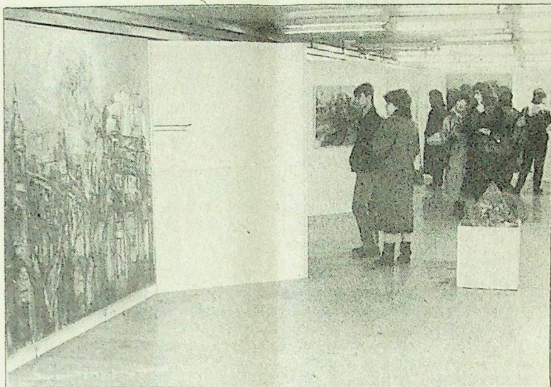
Първите посетители разглеждат изложбата